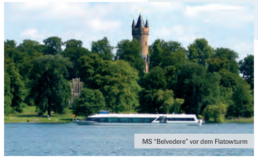
MS "Belvedere" vor dem Flatowturm