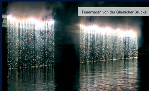
Feuerregen von der Glienicker Brücke